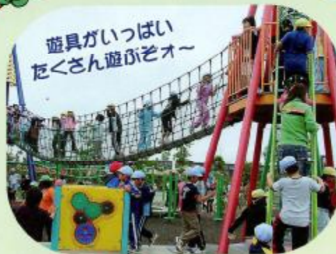
遊具がいっぱい たくさん遊ぶぞー