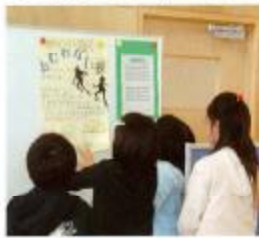
おすすめの本をポスターで紹介します。

前期にはおすすめの本をポスターで紹介したり、新しい本のコーナーを作って、放送で紹介したりしています。