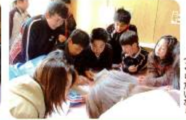
皆が面白い番組をつくりたいなあ