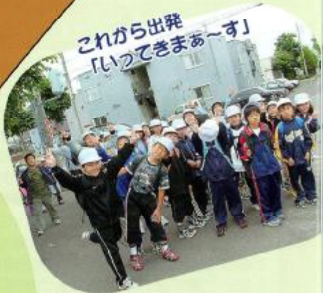
これから出発 「いってきまあーす」