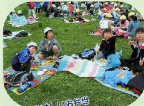
美味しいお弁当 ありがとう