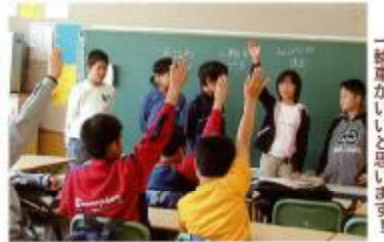
一輪車がいいと思います!