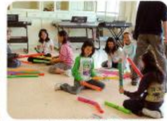
たたくと音がでるドレミパイプ♪