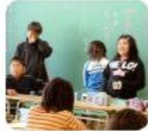
良いアイデアを出して下さい!