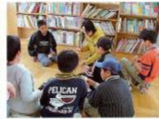
読みたい本を探しやすいように整理整頓しています。