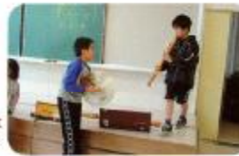
新しい楽器の音はどんな音かな?