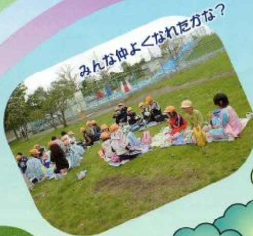
みんな仲よくなれたかな?