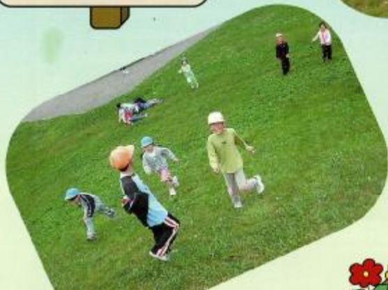
曇の空も吹き飛ばすほど 元気一杯!! 山の上から転がる子も...!?