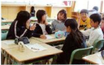
他にどんなあそびがあるかなあ…?