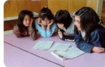
将来はプロデューサー?